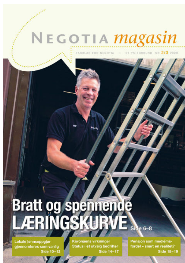
Medlemsbladet Negotia magasin – nr. 2/3-20

Det er en bevisst redaksjonell linje at hvert nummer av magasinet skal inneholde en variert miks av aktuelle saker, med vekt på faglig stoff. Dette harmonerer også bra med tilbakemeldinger og leserundersøkelser. Å synliggjøre bredden av organisasjonens aktiviteter i henhold til strategimålene, hører