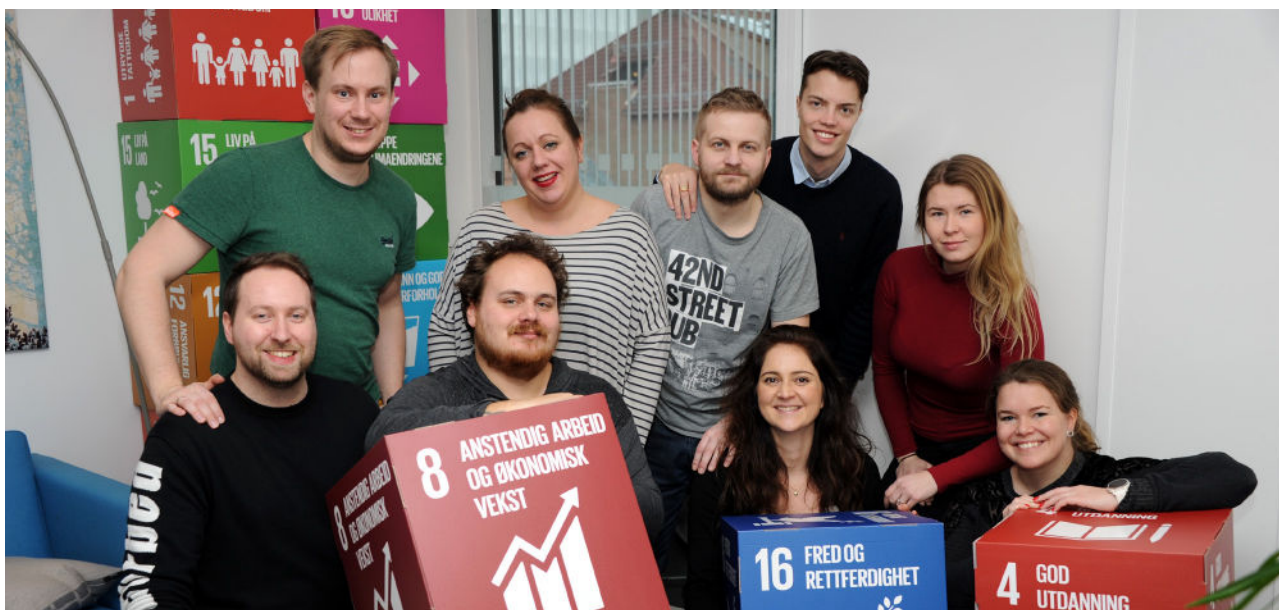
Styremøte i Negotia Ung - rett for koronaen kom. Ung har blant annet etablert podcast hvor ideen er at aktuelle temaer om arbeidsliv og organisering skal belyses på en lettfattelig og tydelig måte.