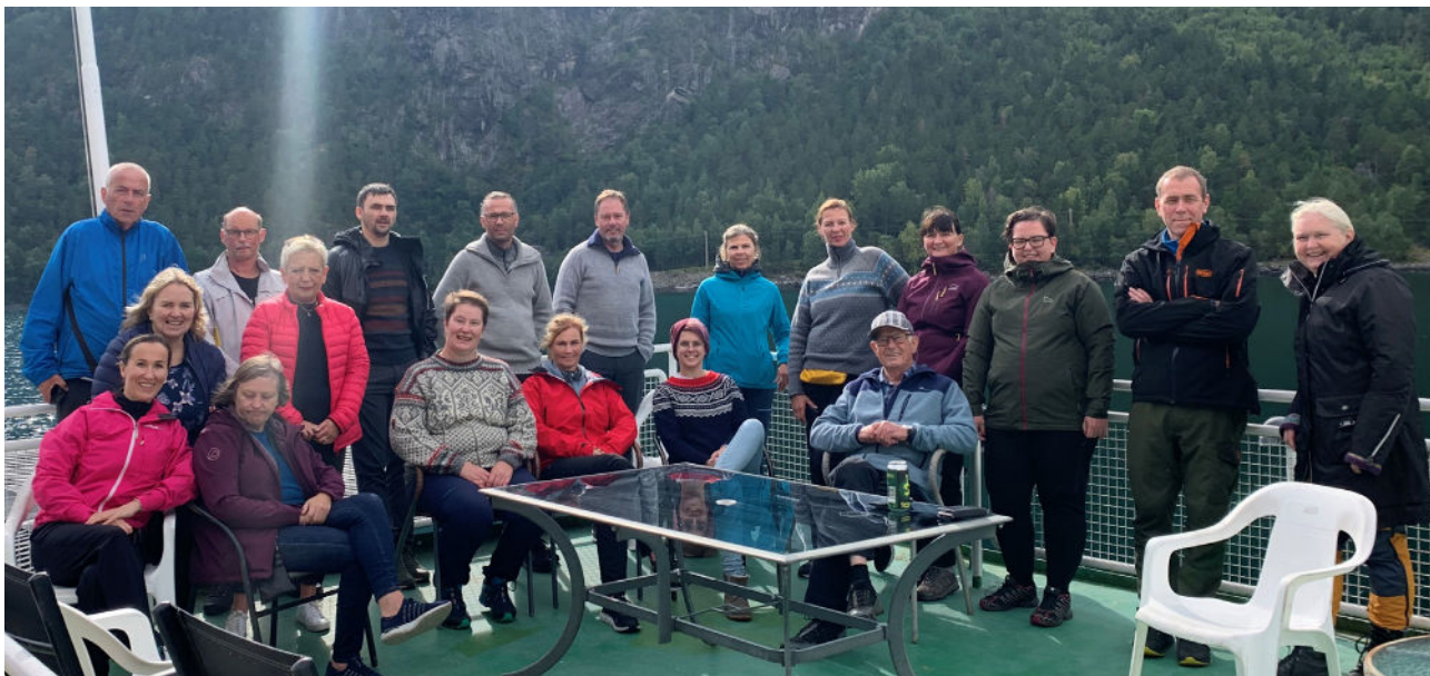
Medlemstur. Region Midt fikk til en medlemstur til Eikesdalen på høstparten. Aktiviteten var støttet med midler fra 3-prosentordningen.

millioner kroner. Midlene er fordelt på 147 klubber og 20 avdelinger. Selv om året har hatt sine begrensinger grunnet koronasituasjonen, har mange funnet måter å gjennomføre aktiviteter på.